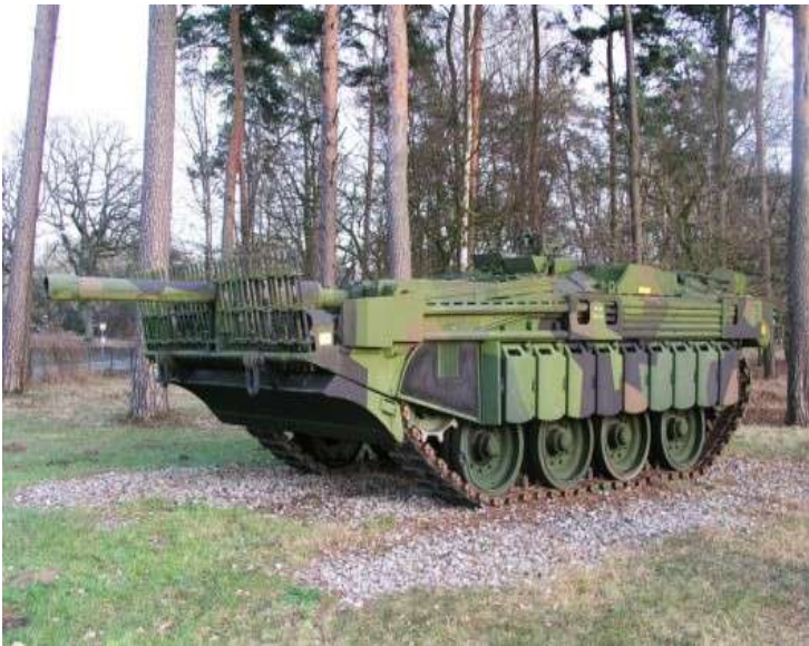
«Безбашенный швед» Strv 103

Как вы думаете, какая часть танка может считаться самой необходимой? Многие считают, что самая важная часть танка – башня, ведь в ней находится управление и основное вооружение боевой машины. Но так ли важна башня? Шведские инженеры доказали, что это не так создав «Безбашенного шведа» Strv 103. Наверное, из названия танка уже становится понятно, в чём его странность или особенность. Для 1950-х годов, когда разрабатывалась эта машина, было нехарактерно вести огонь на ходу, именно с этой проблемой пытались разобраться шведы, они закрепили ствол машины в корпусе и максимально занизили подвеску, что дало возможность открывать огонь в движении. Кстати, S-танк единственный танк в мире, который может управляться всего одним человеком! Данная машина включила в себя большое количество новшеств, но это увеличило его цену и отпугнуло потенциальных заказчиков. К сожалению, танк так и не был востребован, и в 1992 отправился на заслуженный покой.