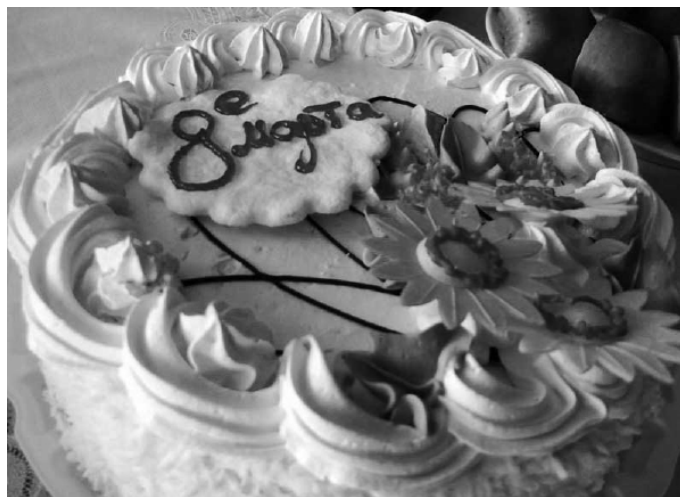
Праздник, организованный Советом Лидеров гимназии, стал лучшим поздравлением для педагогов

оклипы с фотографиями природы, цветов, животных под прекрасную классическую музыку.