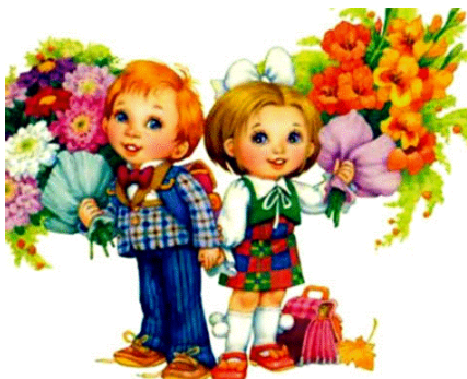
Добираться до школы за пять минут – так ли это выгодно?