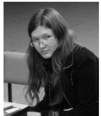
Увлечения Ани математикой не ограничиваются