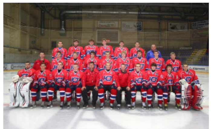
Молодежный хоккейный клуб «Юниор» (г. Курган)

Команда начала свой сезон на выезде, проведя в Нижнем Тагиле, Челябинске и Серове в общей сложности 9 матчей. Из этих 9 игр команда одержала победы в 6 играх, что можно считать хорошим результатом. И в конце второй декады октября команда провела первые три матча на родном льду против «Алтайских Беркутов» из Барнаула и со всех этих встреч уходила победительницей!