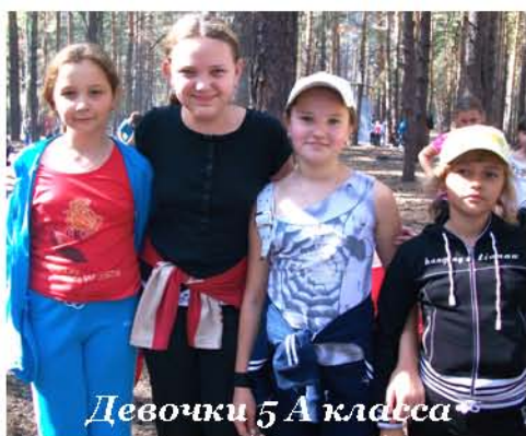
Девочки 5А класса

- Вы теперь учитесь в среднем звене - а это большая ответственность. Как ты относишься к этому?