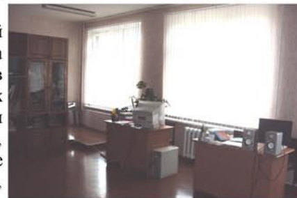
Методический кабинет в 28-ом

Электронный портфолио педагога (лист участия в профессиональных конкурсах, презентации и разработки уроков, исследовательские работы учащихся, рабочие программы по предметам...)