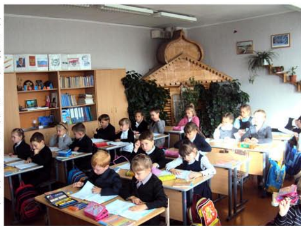
Первоклассники уже включились в учебу