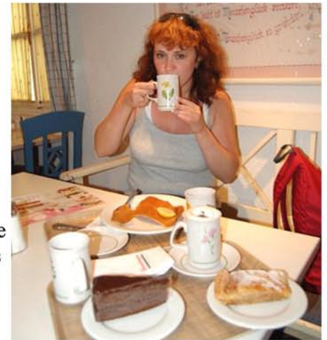
За столиком в кафе

национальное блюдо. В Вене - это шоколадный торт «Захер», штрудель с яблоками, шницель с лимоном и знаменитый венский кофе. В Брюсселе – это бельгийский шоколад и брюссельские вафли. В Польше очень понравился сок. Кстати, самые большие порции в Польше и Чехии. Еще одной особенностью Европы является то, что почти все