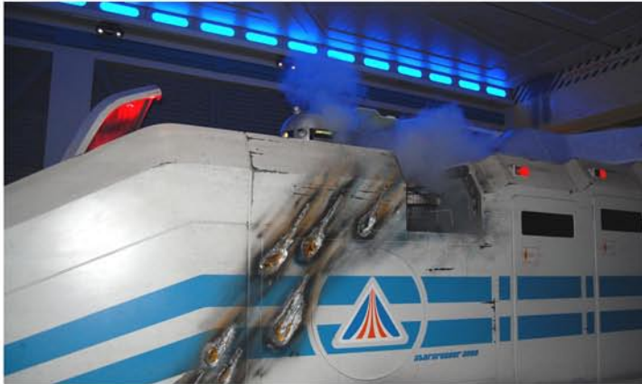
Звездный корабль в Диснейленде

Ну и, конечно же, Диснейленд. Диснейленд – целый мир для детей и взрослых! Как только вы войдете в парк, сразу почувствуете атмосферу сказки. Музыка, театрализованные костюмы служащих, аттракционы на темы мультфильмов Диснея, улыбки прохожих – все создает