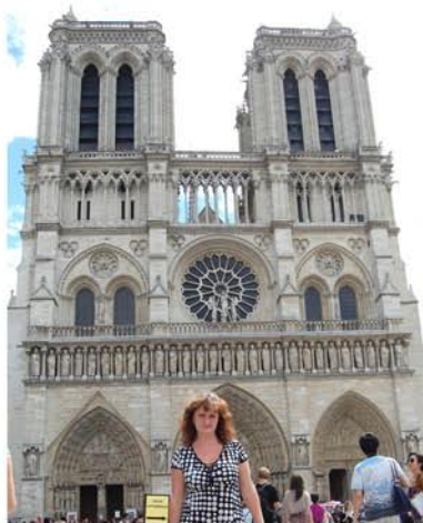
Нотр-Дам де Пари

«Путешествие длилось две недели, за это время мы посетили восемь европейских государств: