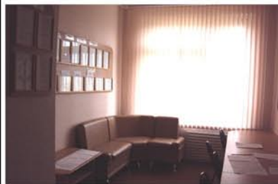
Учительская в 27 кабинете