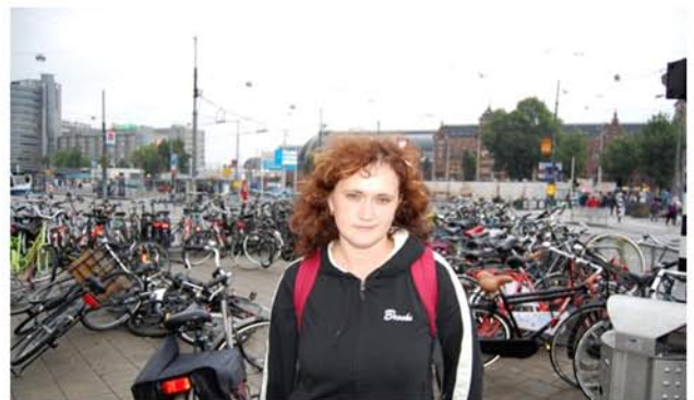
А позади – море велосипедов!

ездят на велосипедах, везде для них установлены парковки, даже есть специальные дороги, светофоры, правила дорожного движения и знаки.