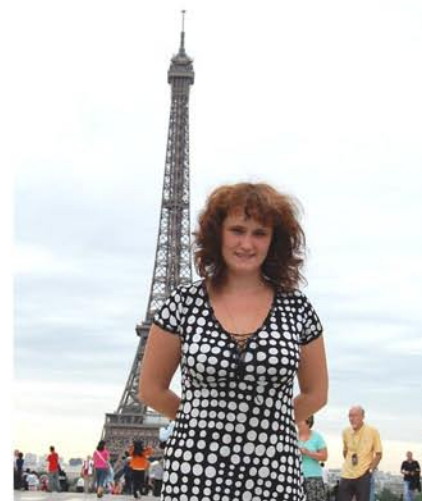
Знаменитая Эйфелева башня!

вознесут вас на 56 этаж (209 метров) за 38 секунд. Эту