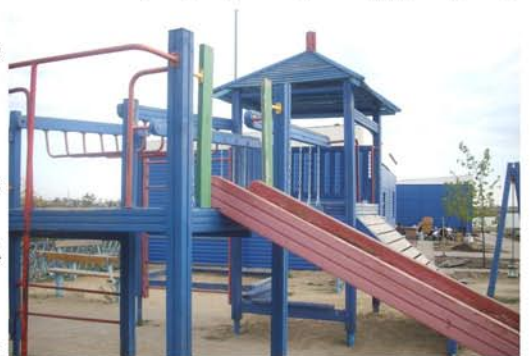
Детская площадка в парке

Хорошо, когда у человека есть дело, нужное не только ему, но и другим людям. Мы привыкли судить о человеке по его делам. И это правильно. Хорошее дело дурными руками не сделаешь. Все мы хотим, чтобы хороших дел было больше. Все мы способны делать хорошие дела, нужно только постараться. Старайся и ты хорошо учиться, уважаемый читатель, и у тебя обязательно всё получится!