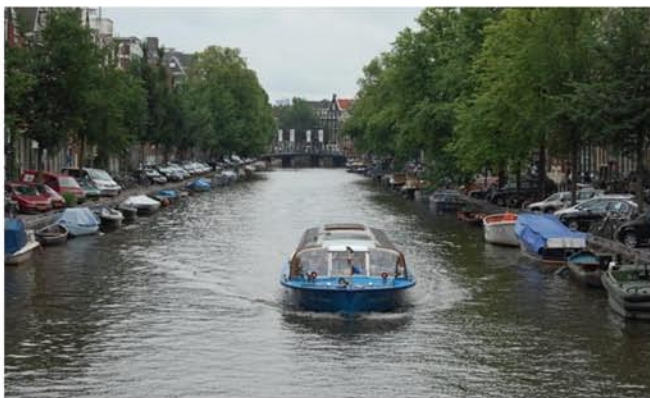
А в некоторых таких лодках живут люди!

праздничное настроение. Весь парк разделен на несколько районов с различной тематикой. Время проходит незаметно даже в очереди за билетами. Есть в Диснейленде и такое понятие как "Fast Pass". Возле каждого аттракциона есть автоматы, к ним подносишь свой билет и получаешь билет на быстрый проход на аттракцион, например с 14:15 до 14:45. Но покупать билеты нужно до обеда, так как они быстро заканчиваются.