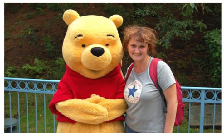
Диснейленд—рай для детей!

башню парижане не любят и называют ее «гнилой зуб» Парижа. После того как ее построили, во Франции запретили возводить подобные здания.